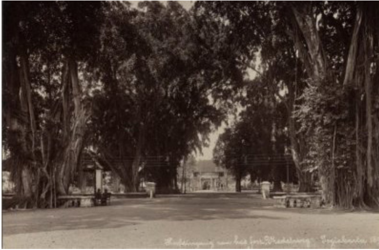
Figur 2. Benteng Vredenburg tahun 1896. Foto diambil dari halaman Kediaman Residen ke arah timur.