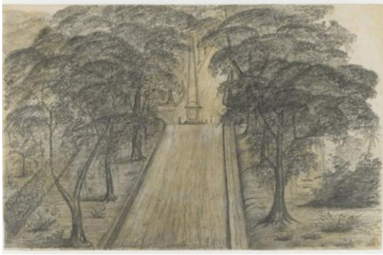
Figur 7. Sketsa karya Anton Baron Sloet van Oldruitenborgh tahun 1848. Dalam sketsa terlihat kedua sisi jalan masih ditumbuhi pepohonan besar dan belum terlihat adanya bangunan di sekitar Tugu Golong Gilig.

dekat pasar. Warung-warung juga mulai tumbuh di sekitar Tugu hingga Pasar Gedhe semenjak meluasnya penduduk Tionghoa dari Kranggan hingga ke sebelah selatan rel kereta api di wilayah Kota Yogyakarta atas izin sultan (Darmosugito, 1956: 26). Sebelum tahun 1880, pasar orang-orang Tionghoa tersebut tidak terlalu besar dan hanya terdiri atas warung-warung—warung yang termasuk besar ialah yang dekat dengan Kepatihan di sebelah utara benteng kompeni (Catatan R.M. Purwalelana dalam Abdurrachman Surjomihardjo, 2008: 55).