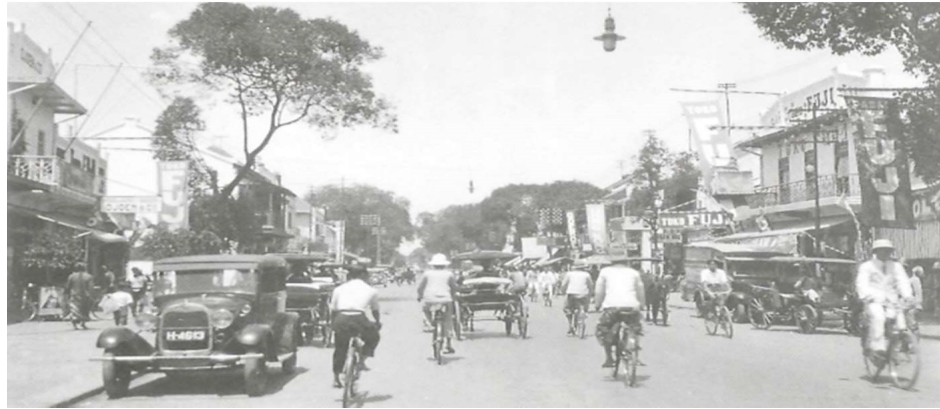
Figur 8. Ruas Patjinan dan ruas Malioboro dengan bangunan-bangunannya yang jauh lebih moderen dan kebaratan setelah awal 1920-an sebagaimana yang terlihat dalam foto sekitar tahun 1935 ini. Pada latar depan foto tampak toko “Fuji” di kedua sisi jalan dan di sisi kiri atau timur jalan terdapat toko roti “Djoen & Co.” milik orang Tionghoa. Toko Fuji yang didirikan oleh Osawa Kenji dan sejak tahun 1915 dikelola oleh Sawabe Masao ini merupakan toko Jepang terbesar di Malioboro.

batik serta kerajinan dan seni dari berbagai daerah di Jawa dan Bali; toko roti; toko buku dan percetakan; toko rokok dan tembakau; toko bunga; studio foto; toko musik; toko sepeda, motor, dan mobil lengkap dengan bengkel dan aksesorisnya; berbagai apotek atau toko obat ala Eropa, Cina, dan Jawa; toko jam; toko optik; toko perhiasan; toko sepatu; toko radio; toko makanan dan minuman; toko mebel; toko besi yang banyak dimiliki oleh pengusaha Tionghoa; toko barang pecah belah; toko stempel; toko mesin jahit; toko es krim dan perusahaan es; toko kelontong dan toserba yang banyak dibuka oleh orang-orang Jepang; toko peralatan listrik; warung opium milik Tionghoa di ruas Patjinan dekat Ketandan 8 ; toko kain ‘bombay’ yang dibuka oleh orang-orang India; dan lain-lain. Toko biasanya dibuka pada pagi hingga siang hari kemudian dibuka kembali jelang sore hingga malam. Pada hari libur atau hari-hari tertentu kerap diadakan diskon yang menarik banyak pembeli.