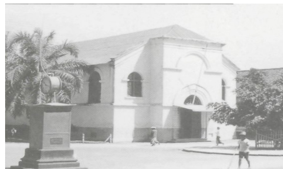
Figur 6. Protestansche Kerk di sudut ruas Kantoorlaan dan Residentielaan. Di sisi kiri foto tampak sebuah jam kota persembahan masyarakat Belanda kepada pemerintahnya untuk memperingati satu abad kembalinya Pemerintahan Kolonial Belanda dari Pemerintahan Inggris tahun 1916. Wilayah di sekitar jam kemudian dikenal dengan nama Ngejaman. Foto: G.H. van de Peppel-von Liebenstein. Sumber: Bruggen, van M.P., Wassing, R.S., dkk., Djokja en Solo Beeld van de Vorstensteden (Purmerend: Asia Maior, 1998), hlm. 127.