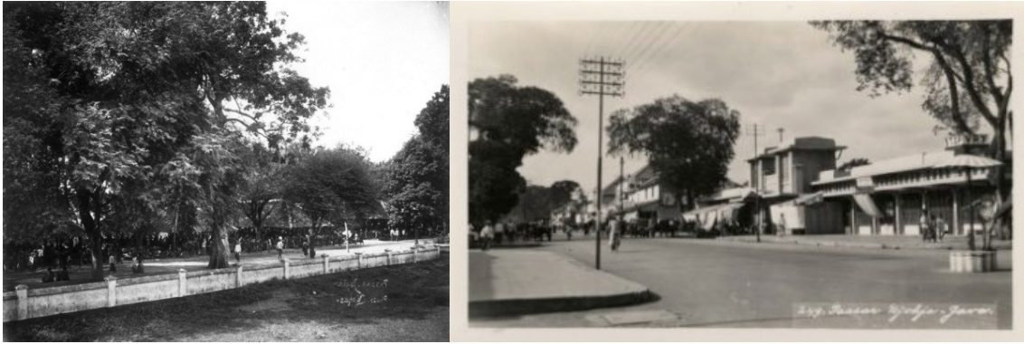
Figur 1. Pasar Gedhe sebelum dan sesudah direnovasi oleh Hollandsche Beton Maatschappij . Foto sebelah kiri diambil sekitar tahun 1900 dari arah utara Benteng Vredenburg memperlihatkan sisi selatan pasar dengan los-los kayu yang memanjang, sedangkan foto sebelah kanan diambil sekitar tahun 1935 dari sisi barat ruas jalan Patjinan memperlihatkan bagian depan pasar yang modern.

Tiap harinya pasar selalu ramai oleh para pedagang dan pembeli baik dalam maupun luar Kota Yogyakarta.