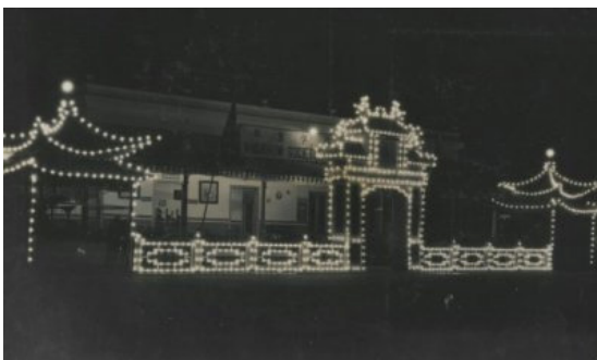
Figur 5. Chineesche Societeit Hwa Kiauw dihiasi lampu-lampu saat perayaan 50 tahun Ratu Wilhelmina, tahun 1930. Pada akhir tahun 1945, bangunan ini lebih dikenal dengan nama Chung Hua Tsung Hui (CHTH) sesuai dengan nama perkumpulan Tionghoa yang ada disana.

Selama periode cultuurstelsel (1830-1870) para pemodal swasta mulai menyewa tanah kasultanan dan membuka berbagai usaha industri dan perkebunan di Yogyakarta. Sejak saat itu semakin banyak pengusaha swasta, terutama Eropa, yang datang. Guna mengakomodir jemaat Eropa beragama Protestan yang kian bertambah maka dibangunlah Protestansche Kerk (sekarang GPIB Margo Mulyo) di selatan Kantor Residen untuk menggantikan gereja di dalam Benteng Vredeburg. Gereja yang dibangun selama 15 Oktober 1853-13 Oktober 1957 dan didesain oleh Ir. P.A. Holm ini diresmikan tanggal 15 Oktober 1857.